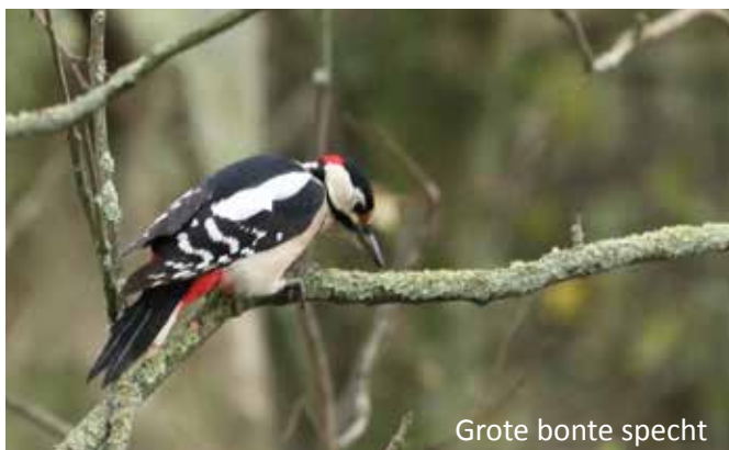
Grote bonte specht

De eerste tiftjaf heeft zich al laten horen en op de stadswallen zijn broedvogels druk doende om hun territorium af te bakenen. Alom hoor je de roep van de boomklever. Als je goed luistert kun je ook het zachte geluid van de boomkruiper horen. De Grote bonte specht heeft de beste dode tak opgezocht, zodat van ver te horen is waar het knapste 'spechtje' van de klas zit. Let dit jaar maar goed op de spechten, want ook de Kleine bonte specht wordt steeds vaker gezien. En nog zeldzamer; de Middelste bonte specht. Vogelboek erbij dus als je een specht ziet.